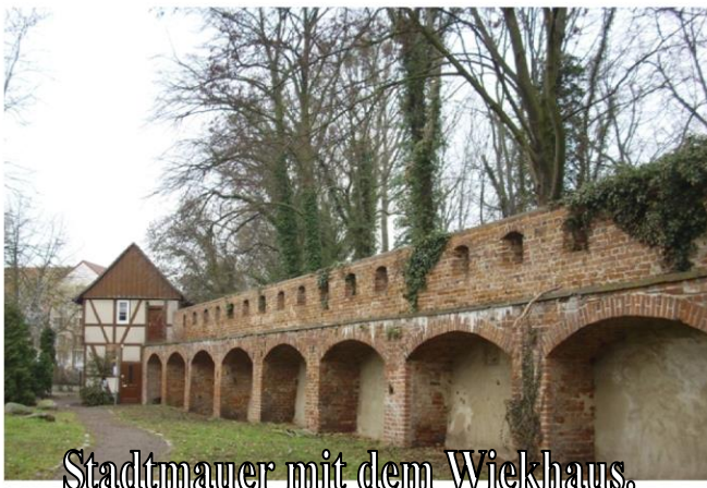
Stadtmauer mit dem Wickhaus.